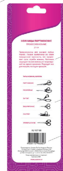
Подробное описание продукта